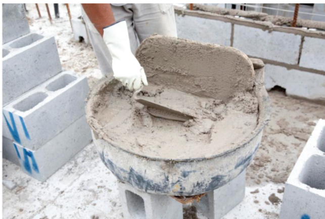
Acondicionamento da argamassa

A argamassa deve ser acondicionada em uma argamaseira metálica ou plástica que garanta a estanqueidade. O volume da argamaseira deve ser tal que toda a argamassa seja consumida no prazo máximo de 2h30min. Durante o período de uso, a argamassa poderá ter a consistência ajustada mediante a adição de água no máximo duas vezes.