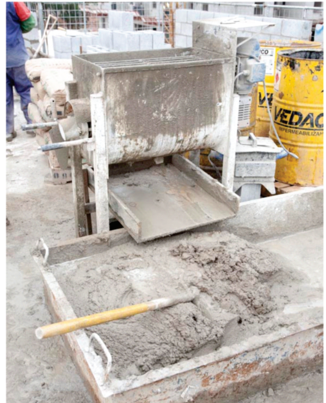
Acondicionamento da argamassa